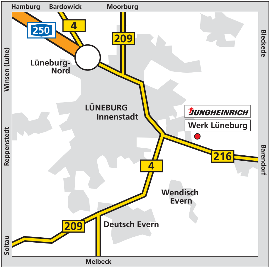
Übersicht Großraum Lüneburg