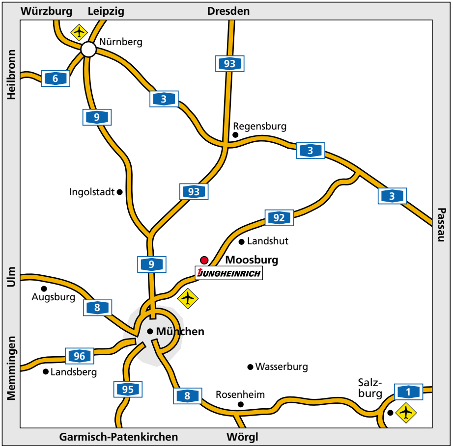
Übersicht Großraum Moosburg