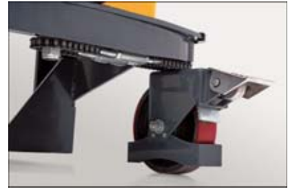
Lenkrad mit Feststellbremse