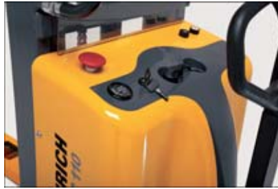
Übersichtliche Anordnung aller Bedien- und Anzeigeelemente

Für das gelegentliche Ein- und Ausstapeln bis zu einer Hubhöhe von 3000 mm bietet der HC 110 im Vergleich zu Geräten mit Fahrmotor eine kostengünstige Alternative. Mit seinen unterschiedlichen Mastvarianten (1600, 2500 und 3000 mm) und einem leistungsstarken 1,5-kW-Hubmotor deckt er eine Vielzahl von Anwendungen ab. In der 1600-mm-Mastvariante eignet sich der HC 110 beispielsweise zum Be- und Entladen von Nutzfahrzeugen, zum Übereinanderstapeln zweier Paletten oder auch als Arbeitstisch.