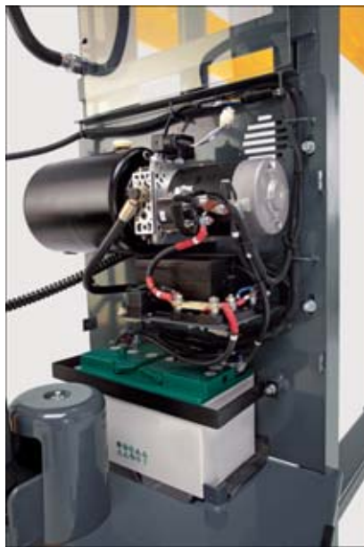
Gute Zugänglichkeit zu allen Komponenten