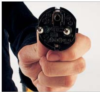
Einfach an die 230-V-Steckdose

Die elektrohydraulische Hubsteuerung und die gute Erreichbarkeit der Hub- und Senk-funktionstaster gewährleisten ein präzises Positionieren der Gabeln. Alle Bedien- und Anzeigeelemente sind übersichtlich angeordnet.