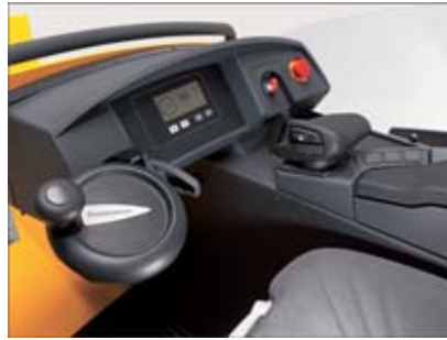
Optimale Anordnung der Bedienelemente