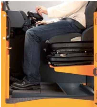
Viel Beinfreiheit mit individueller Fußhöhenverstellung