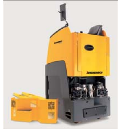
Leicht zugängliche Aggregate durch große Serviceöffnungen