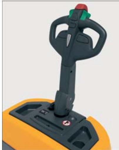
Handlich und wendig

Durch das äußerst kurze Vorderbaumaß (450 mm) und die sehr geringe Breite (710 mm) lässt sich der EME optimal in engen Passagen rangieren. Somit ist der EME 114 sehr kompakt und lässt sich auch auf kleinstem Raum einfach steuern.