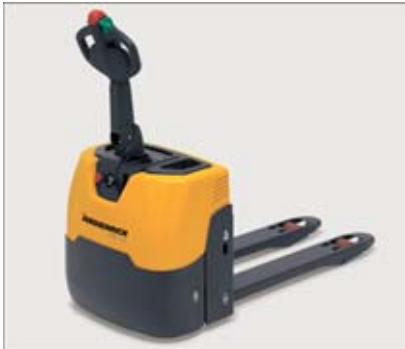
Einstieg in die elektromotorische Klasse