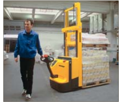
Doppelstocktransport von zwei Paletten