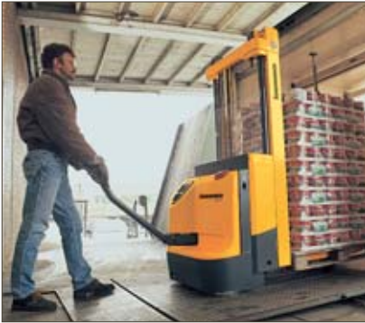
Überfahren einer Ladebrücke mit dem EJC Z