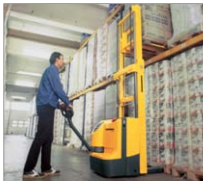
Einstapeln mit dem EJC Z14