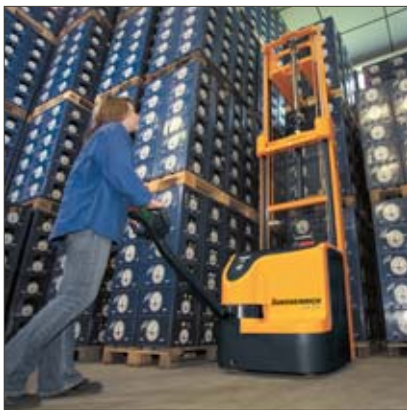
Stapeln von Bierkisten durch hohe Resttragfähigkeiten