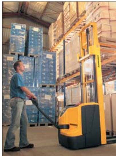
Optimale Sichtverhältnisse durch schlankes Hubgerüst