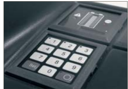
Jungheinrich-CanCode und -CanDis (optional)