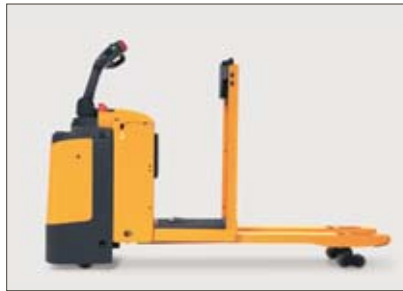
Gute Bodenfreiheit durch mithebende Batterie und Standplattform