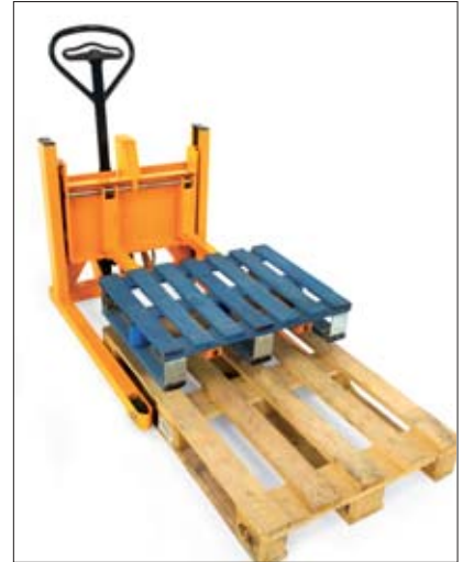
Abnahme einer Halbpalette von einer Standard-Europalette