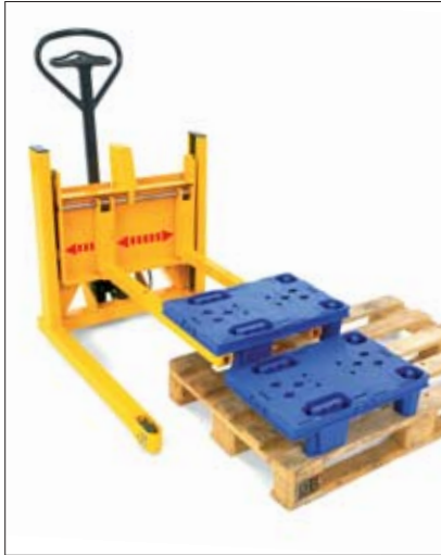
Abnahme einer Viertelpalette