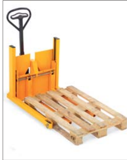
Aufnahme einer Standard-Europalette