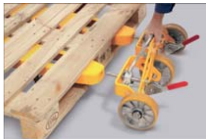
Radträgersystem für unebenes Gelände

Die großen Räder an der Gabelspitze gewährleisten Mobilität und Geländetauglichkeit auf nahezu jedem festen, aber unebenen Untergrund. Der Radträger wird nach Durchfahren der Palette einfach in die zusätzlichen Gabelverlängerungen eingesetzt.