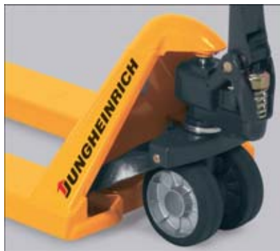
Dauerhaft geschmierte Verbindungen für einen wartungsfreien Einsatz

Die chromatierten Buchsen der Räder und Gelenke gewährleisten ruhige Laufeigenschaften und eine besonders lange Lebensdauer. Verbindungen müssen nicht mehr gefettet werden; der AM 20t läuft „wie geschmiert“.